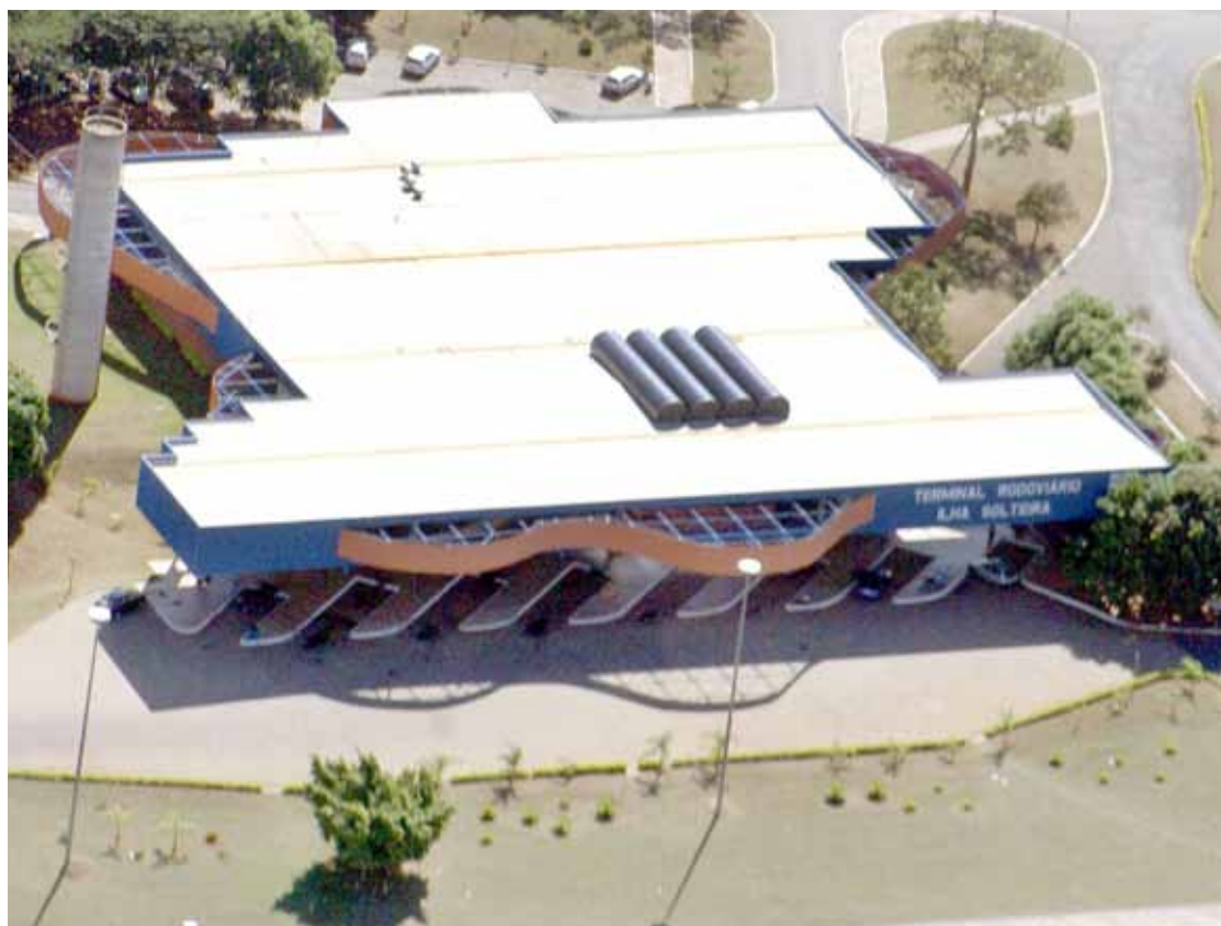
Terminal Rodoviário é um dos pontos com internet livre no município.

De acordo com informações da Prefeitura, o sinal Wi-Fi público funciona 24 horas por dia e a velocidade do serviço não é diferente ou inferior à de outros serviços