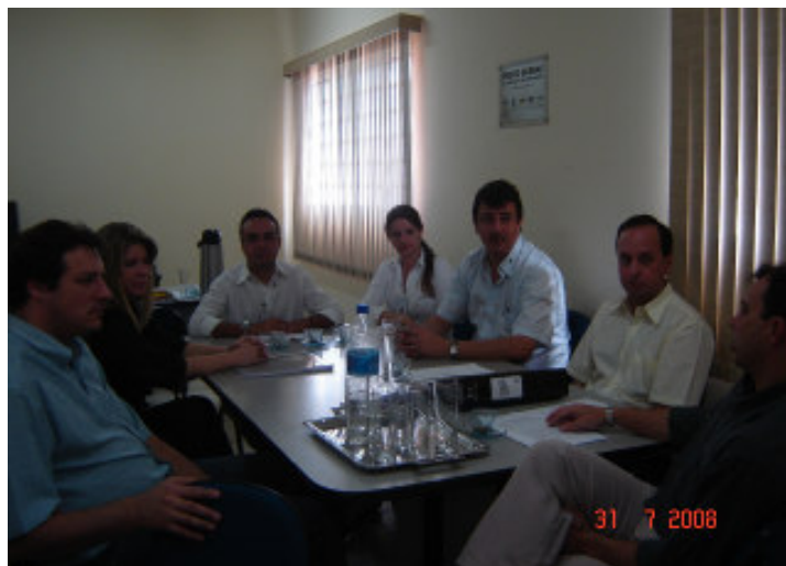
Posto de Atendimento ao Empreendedor