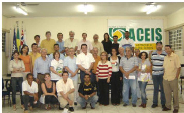
Associação dos Moradores Amigos de Ilha Solteira