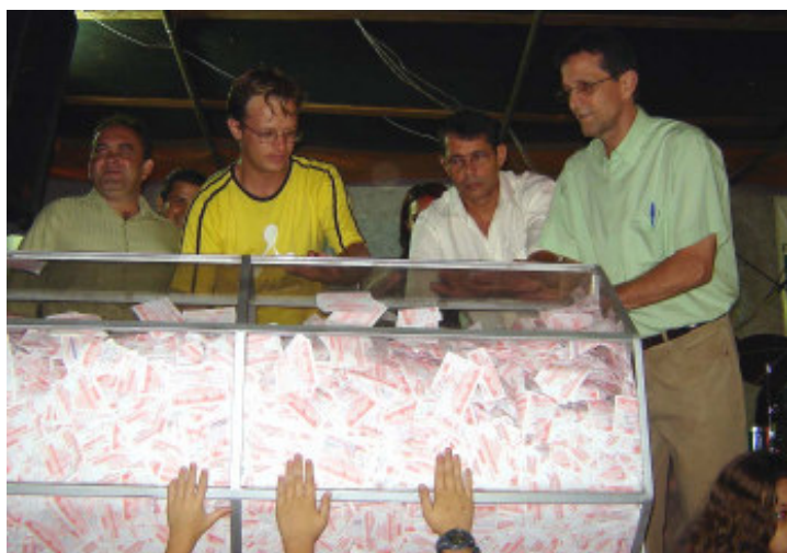
Sorteio 200 mil cupons foram confeccionados e distribuídos pelo comércio para o sorteio

Sorteio de prêmios e show de música sertaneja, popular brasileira e axé foram as atrações do encerramento da Campanha "Natal Premiado" da Associação Comercial e Empresarial de Ilha Solteira e do Projeto Natal Iluminado desenvolvido pela prefeitura