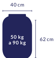
BOMBONA DE 60 LITROS

CUIDADO: devido à grande diversidade de pilhas e baterias portáteis pós-consumo, a massa armazenada pode variar bastante. Preste atenção no peso máximo que a embalagem suporta!