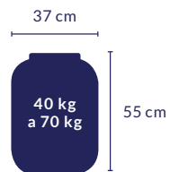
BOMBONA DE 50 LITROS