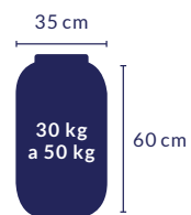
BOMBONA DE 40 LITROS

Veja a seguir alguns tipos de embalagens que podem ser usadas, além da capacidade aproximada de pilhas e baterias portáteis pós-consumo que podem ser armazenadas. Escolha bombonas com tampa e preferencialmente com alça.